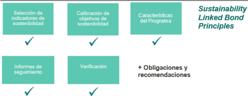
Figura 4-1. Calificación global del Programa.

Marco normativo de referencia para la financiación vinculada a la sostenibilidad