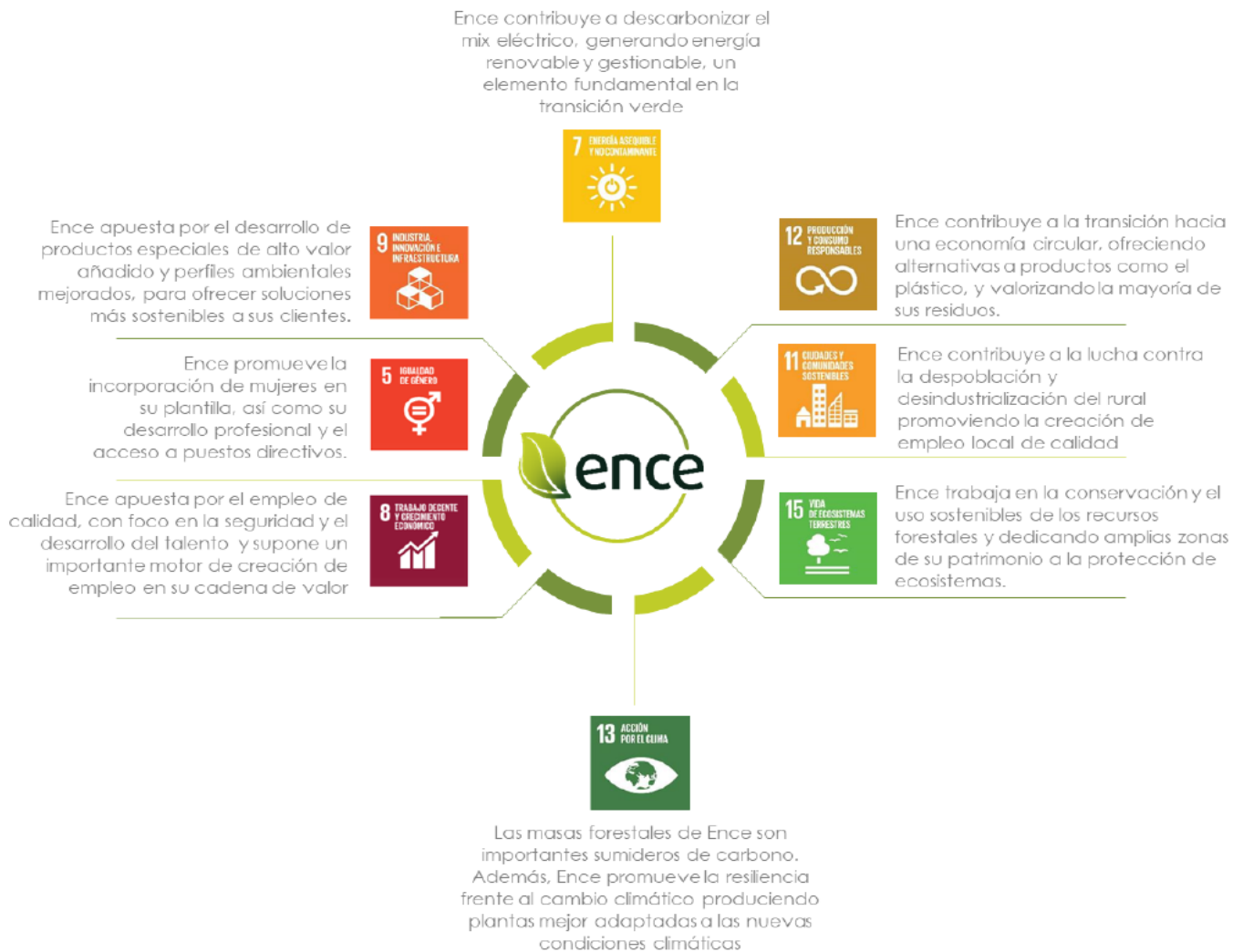
Figura 2-4. ODS a los que contribuye Ence.